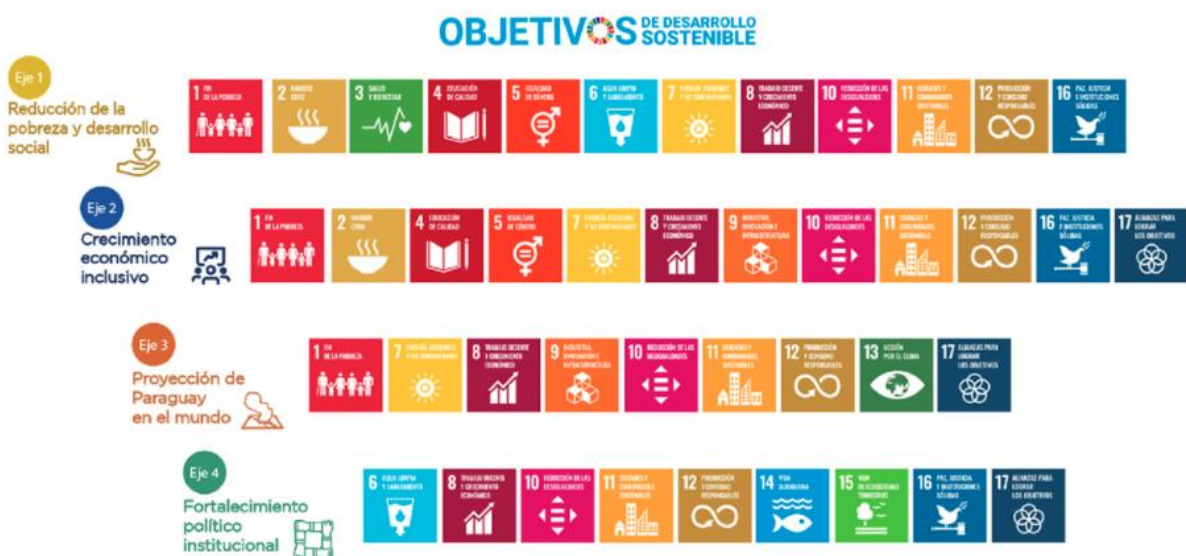
Imagen: Vinculación de los ejes estratégicos del PND con los objetivos de desarrollo sostenible

En el año 2017, el gobierno paraguayo, como miembro de las Naciones Unidas, se comprometió a implementar la Agenda 2030, como un plan de acción en favor de las personas, el planeta, la prosperidad, la paz y las alianzas; un plan para liberar a la humanidad y poner fin a la pobreza en todas sus formas, así como sanar y proteger nuestro planeta para las generaciones futuras.